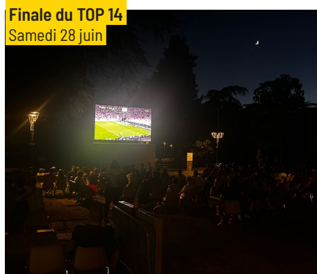
Finale du TOP 14 Samedi 28 juin