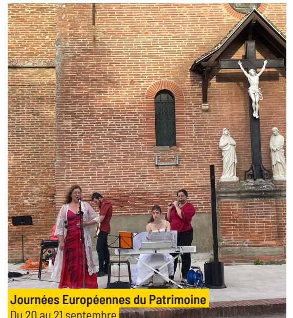
Journées Européennes du Patrimoine Du 20 au 21 septembre