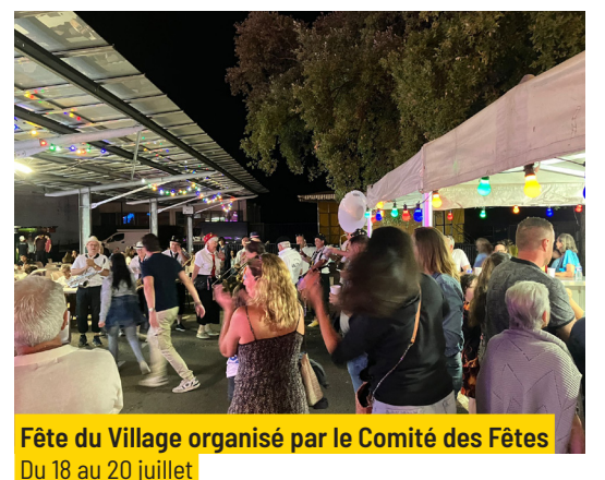
Fête du Village organisé par le Comité des Fêtes Du 18 au 20 juillet