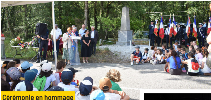
Cérémonie en hommage aux résistants fusillés à Bouconne Jeudi 12 juin