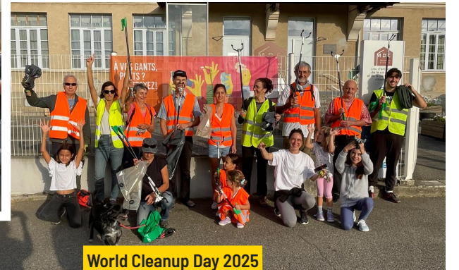
World Cleanup Day 2025 Samedi 20 septembre