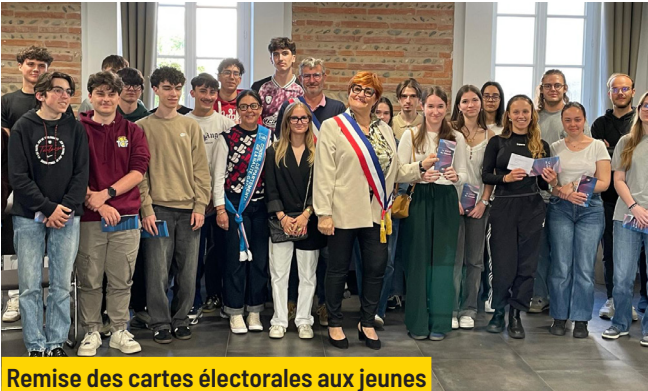
Remise des cartes électorales aux jeunes Vendredi 23 mai