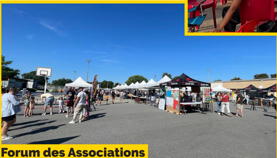
Forum des Associations Samedi 6 septembre