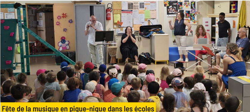
Fête de la musique en pique-nique dans les écoles Vendredi 20 juin