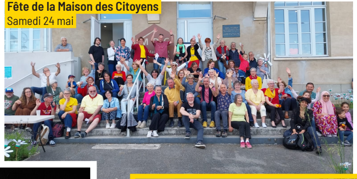
Fête de la Maison des Citoyens Samedi 24 mai