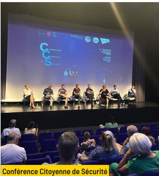
Conférence Citoyenne de Sécurité Lundi 23 juin