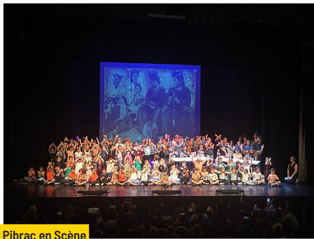
Pibrac en Scène Mai à juin