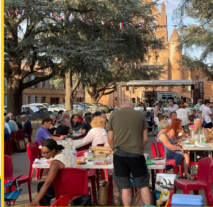
Fête Nationale Lundi 14 juillet