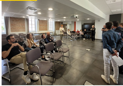
Journée des Nouveaux Arrivants Samedi 24 mai