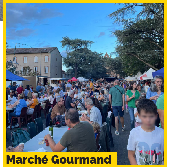
Marché Gourmand Samedi 30 août