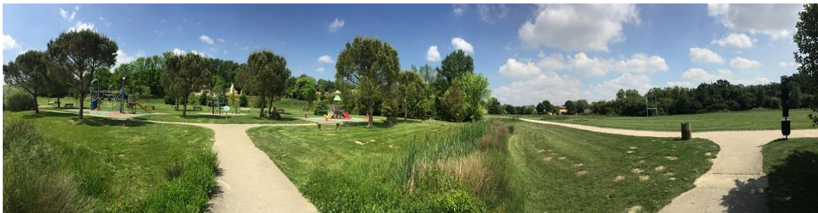
Aire des Tambourettes

Il est donc nécessaire de remplir les deux annexes au présent cahier des charges pour pouvoir se porter candidat à l'exploitation commerciale.