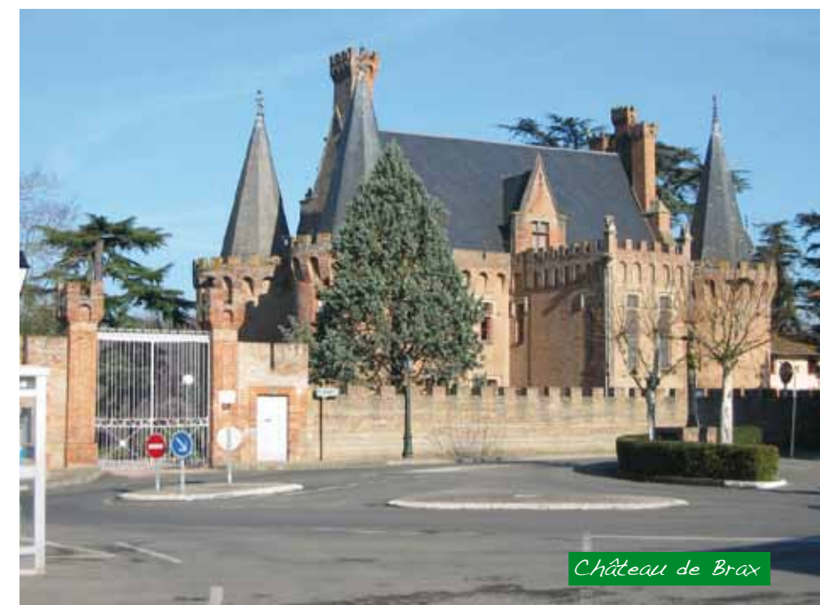
Château de Brax

Le Château de Brax a été construit à 3 époques : XIII e , XVI e et XVIII e siècle. Il est classé aux monuments historiques depuis 1946. Le Château appartient désormais à l'association pour la Sauvegarde des Enfants Invalides. Le bâtiment abrite l'Institut pour le Développement de l'Audition et la Communication (IDAC).