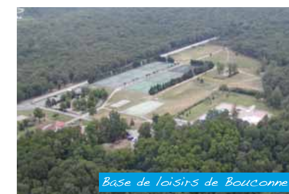
Base de loisirs de Bouconne