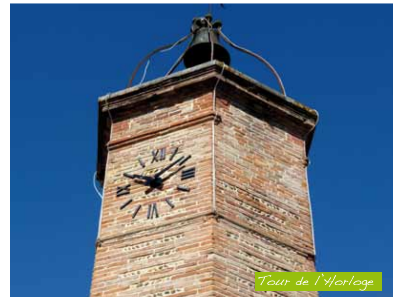
Tour de l'Horloge

La Tour est construite entre 1844 et 1852 par le maçon Rives de Mondonville. Cette tour de style Campanile est érigée au milieu du village afin de porter l'horloge à la vue des habitants, conformément aux exigences du préfet qui ne peut autoriser l'établissement d'un bureau de poste que si la commune se dote d'une horloge visible.