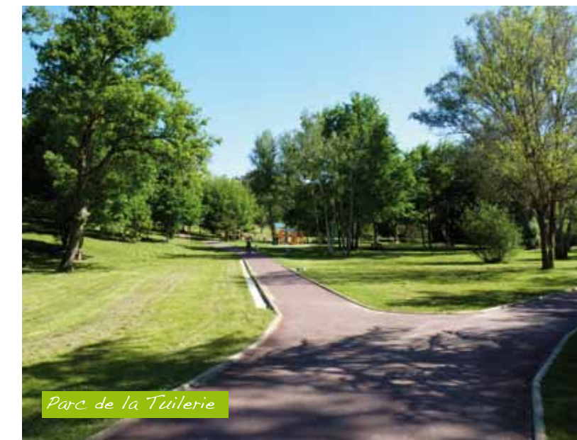
Parc de la Tuilerie

D'une surface de 2 ha, le parc de la Tuilerie est aménagé en bas de la commune. Le ruisseau du Gajéa serpente à travers ce parc.